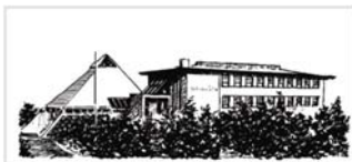
Safnahúsið á Húsavík