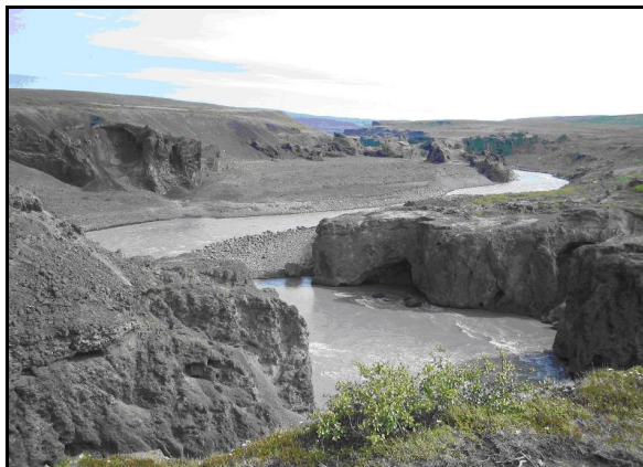
Mynd 1 Jökulsárgljúfur.

Jökulsárgljúfur eru ein stærstu og hrikalegustu gljúfur landsins. Stórkostlegt umhverfi Jökulsárgljúfra er mótað af vatni, eldi og ís. Gífurleg hamfarahlaup eru talin hafa myndað og mótað meðal annars ýmis gljúfur og byrgi. Frægust þeirra er Ásbyrgi. Ábyrgi er stórbrotið náttúrufyribæri, hamraveggirnir eru um 100 m háir þar sem þeir eru hæstir. Mikill birkiskógur er í Ásbyrgi en Ásbyrgi er í eigu Skógræktar ríkisins. Nokkrir fossar eru í Gljúfrunum og er Dettifoss þeirra mestur. Hann er 44 m. hár og er talinn vera aflmesti foss í Evrópu. 6