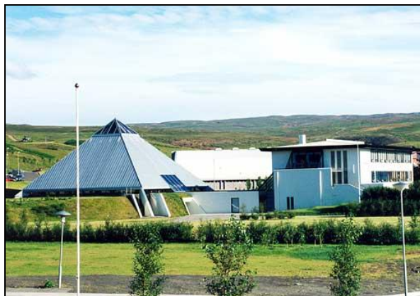
Safnahúsið á Húsavík. Vinstra megin er nýbygging sem hýsir nú sjóminjasafn. Hægra megin er samtengd aðalbyggingin.

Safnahúsið á Húsavík myndi hýsa „aðalinngang“ Náttúruminjasafns Íslands. Með endurskipulagningu húsnaðiskosts Menningarmiðstöðvar Þingeyinga væri hægt að koma slíku fyrir strax án nýbyggingar.